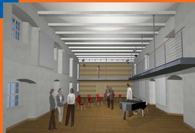
➤ Kammermusiksaal (Architektenzeichnung)